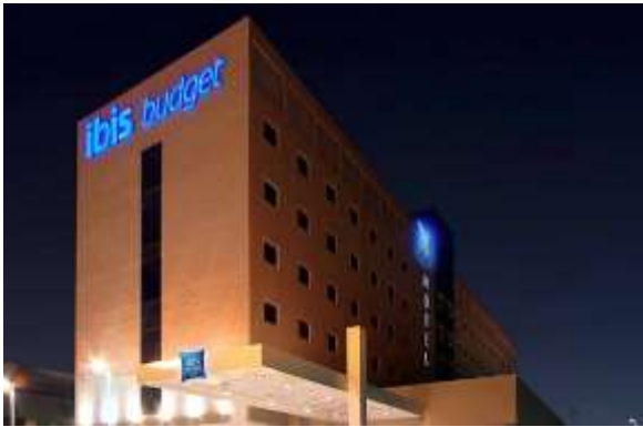
Ibis Budget Campo Grande